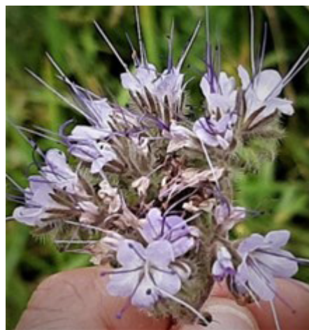
Figura 1. Facelia în perioada înfloririi.

Odonata. Dintre speciile de libelule, 4 au fost identificate în cultura de facelia, iar 10 – în biotopurile adiacente, în special pe vegetația erbacee sau cea palustră din jurul iazurilor (Figura 2). O specie de libelule Aeshna affinis a fost identificată în premieră pentru rezervație.