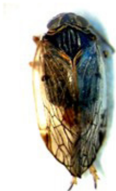
Figura 3. Reptalus quiquecostatus

Hemiptera. În rezervație au fost identificate 39 de specii de cicade, dintre care 14 – în facelia, iar 33 de specii – în biotopurile adiacente de luncă, pajiște și în liziera pădurii. Speciile de cicade identificate sunt atribuite la 6 familii: Aphrophoridae, Membracidae, Cicadellidae, Delphacidae, Cixiidae și Tropiduchidae. În premieră, pentru teritoriul rezervației, sunt citate 17 specii de cicade (Figura 3, 4, Tabelul 1).