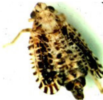
Figura 4. Trypetimorpha occidentalis