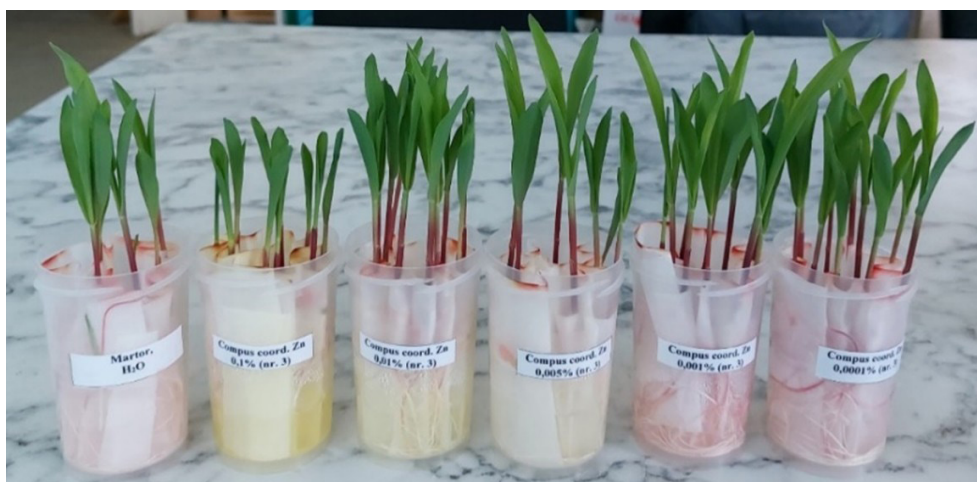
Figura 2. Influența CCZn asupra creșterii plantulelor de porumb. Experiență de laborator

Tratarea semințelor cu soluții apoase de CCZn intensifică procesele de creștere a plantulelor în mod diferit, în funcție de concentrația soluției utilizată. Rezultatele obținute sunt prezentate în tabelul 1 și demonstrează un efect fiziologic pozitiv semnificativ al CCZn în intervalul de concentrații 0,0001- 0,01%.