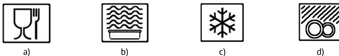
Figura 1. Pictogramele care reflectă siguranța ambalajului din plastic: a) admis pentru contactul cu produsele alimentare; b) siguranță pentru utilizarea în cuptoarele cu microunde; c) siguranța pentru utilizarea în frigidere; d) siguranța pentru utilizarea în mașinile de spălat.

Ambalajele din plastic sunt fie de calitate alimentară, fie nealimentare. Ambalajele de calitate alimentară au specificațiile necesare pentru contactul cu alimentele, spre deosebire de cele nealimentare. Principalele pictograme care autorizează utilizarea materialelor plastice pentru contactul cu alimentele sunt prezentate în Figura 1.